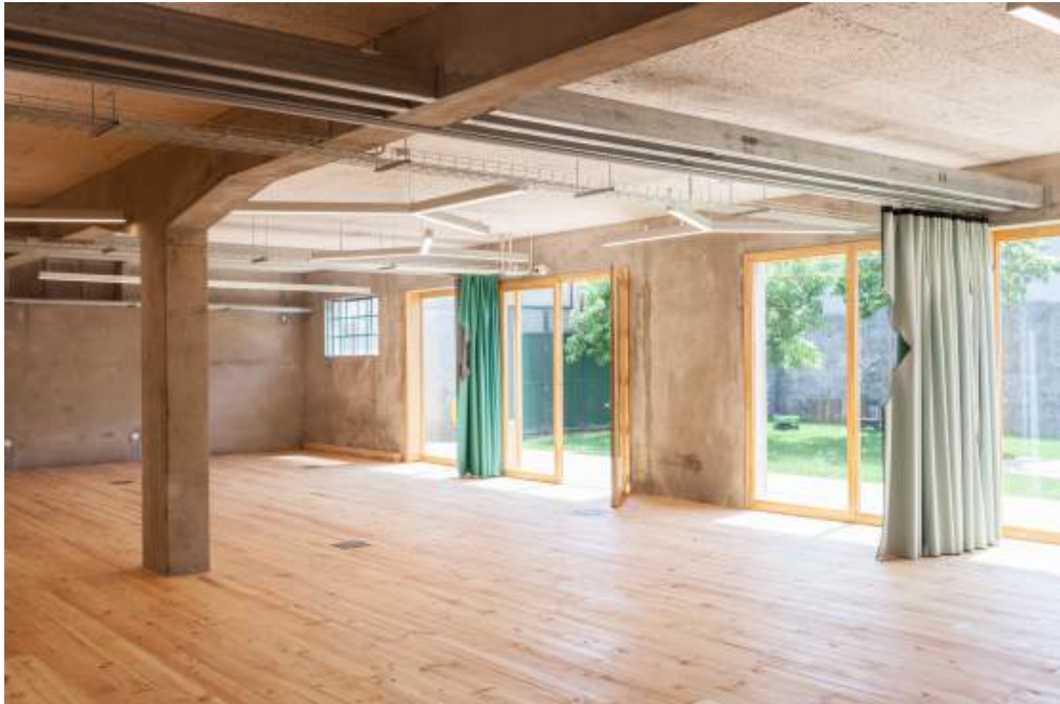
Armazém Cowork, colectivo oitoo