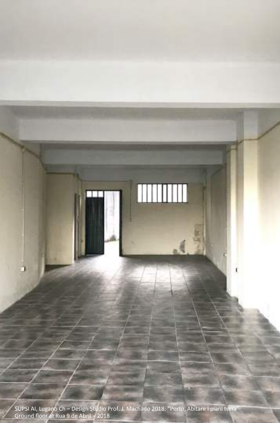
SUPSI AI, Lugano Ch – Design Studio Prof. J. Machado 2018: “Porto, Abitare i piani terra” Ground floor at Rua 9 de Abril – 2018