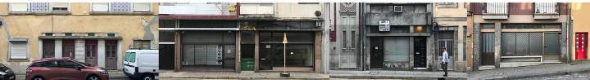
An awaiting city...