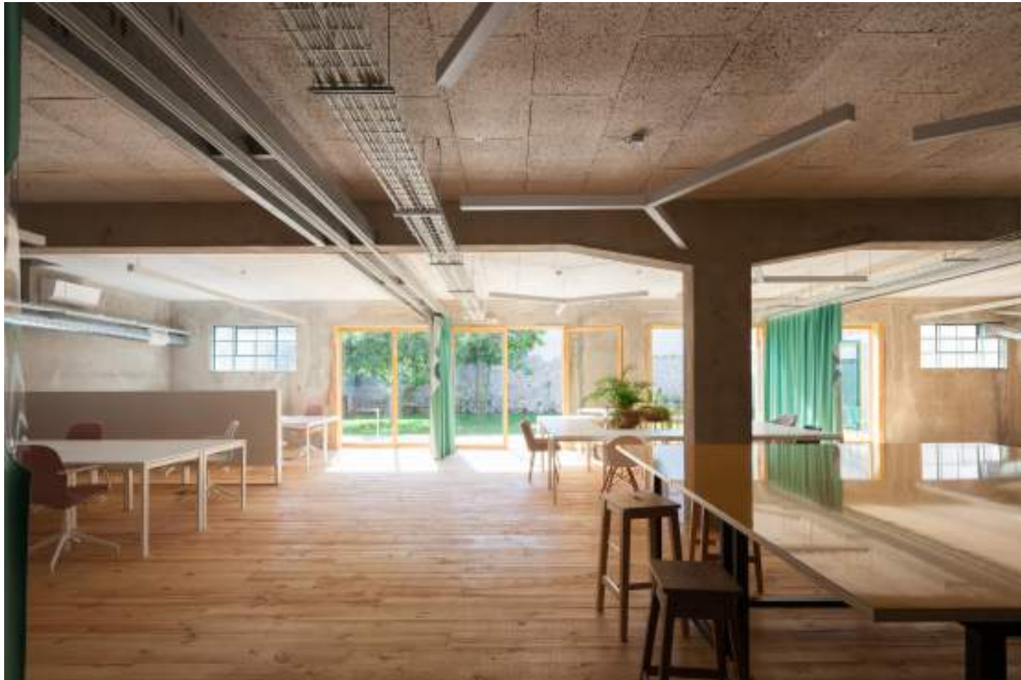
Armazém Cowork, colectivo oitoo