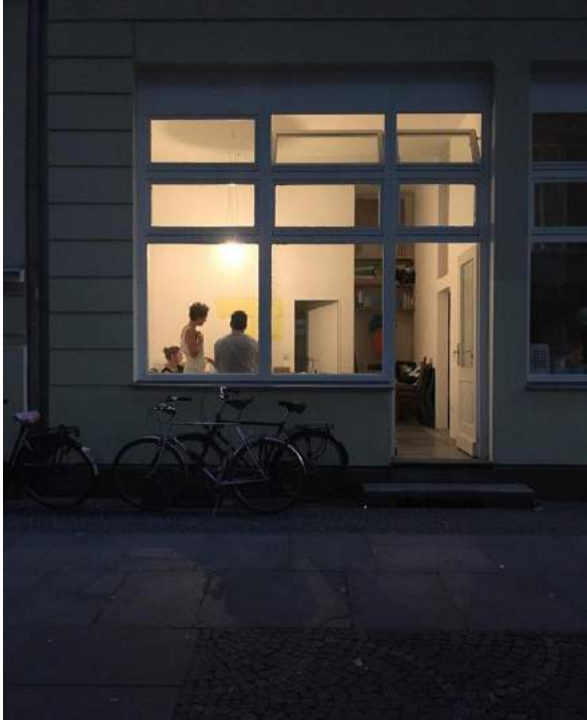
Berlin, ground floor apartment