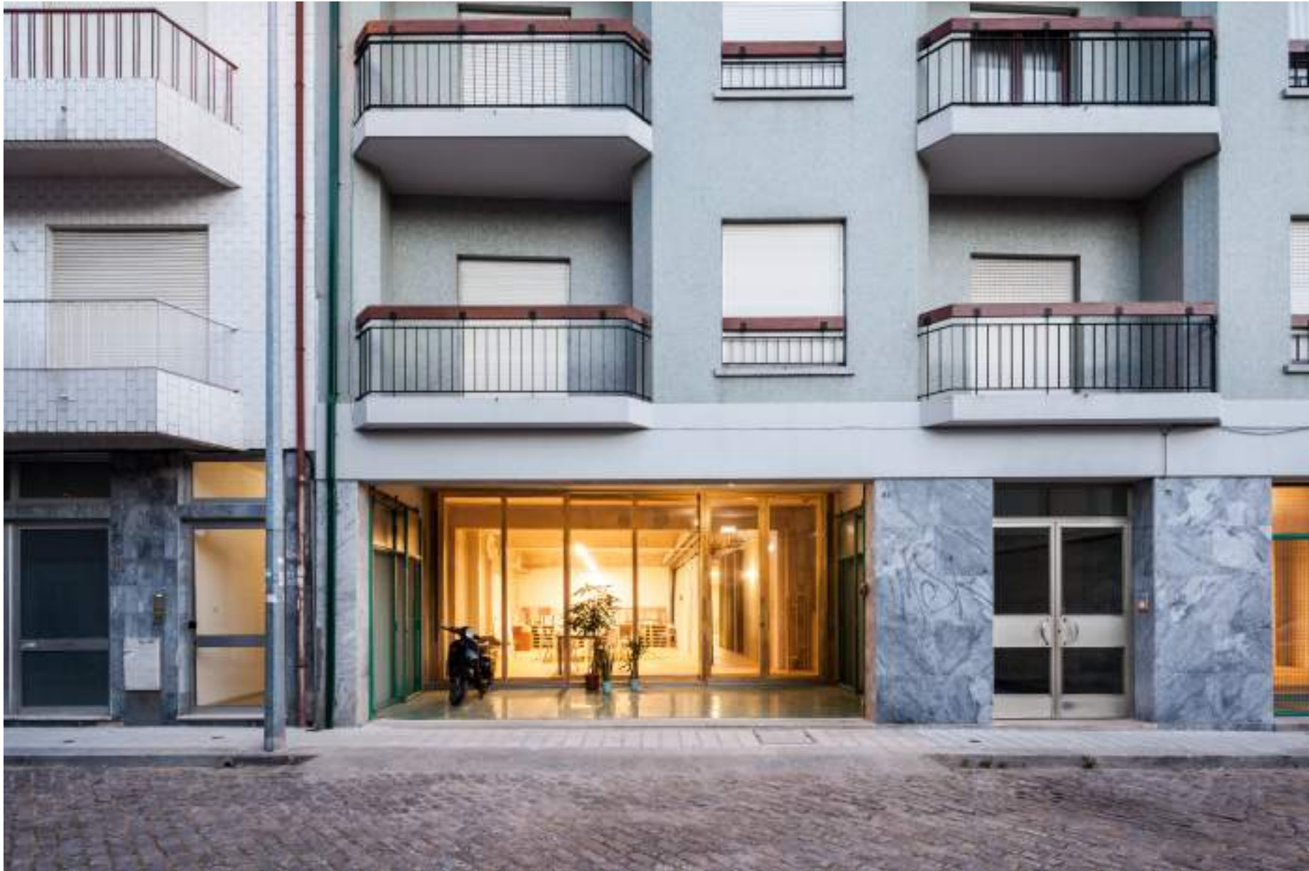
Armazém Cowork, colectivo oitoo