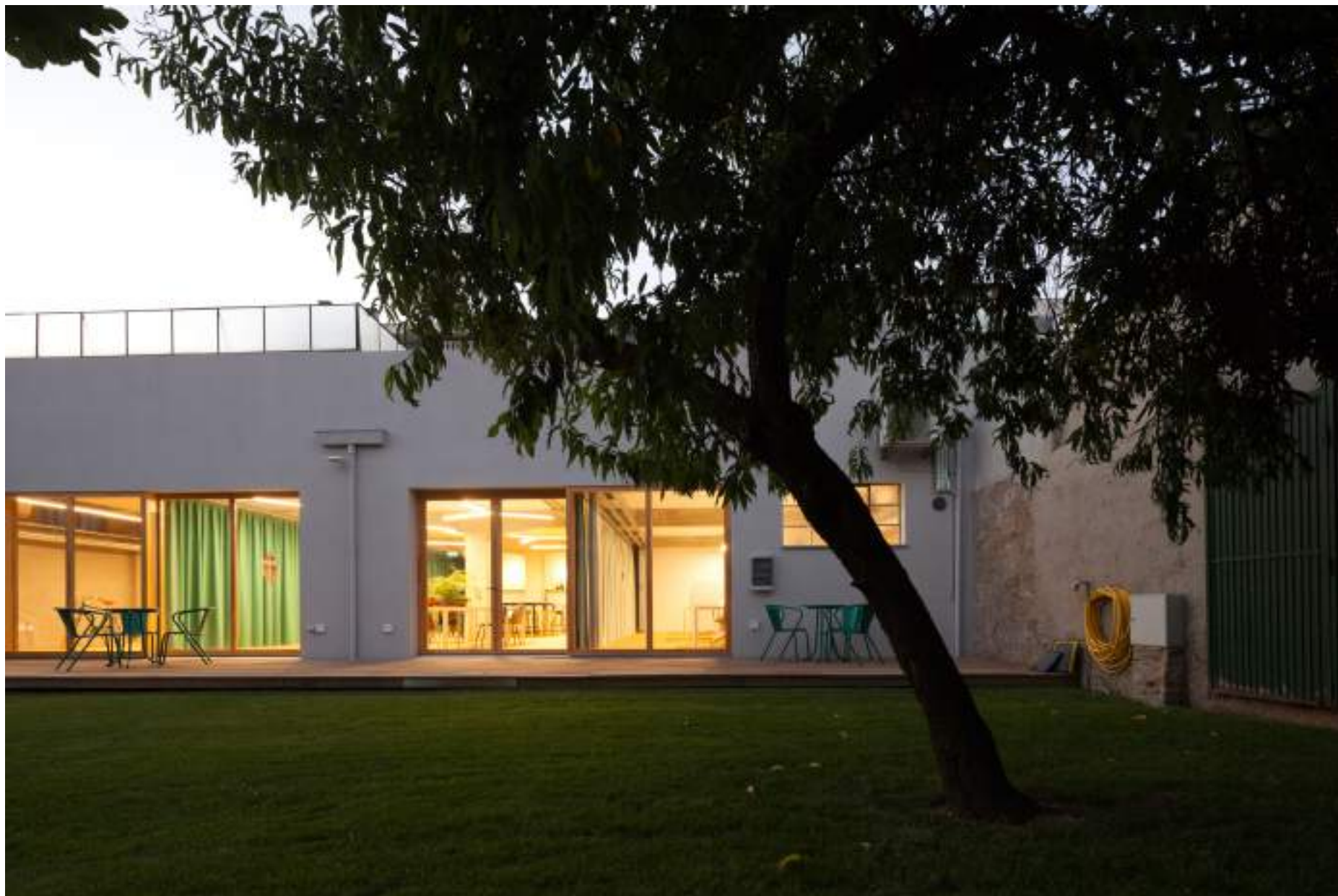
Armazém Cowork, colectivo oitoo