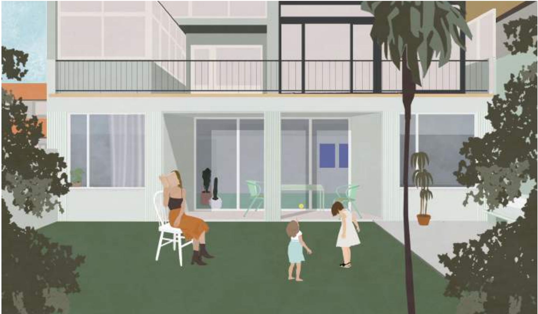
Backyard – „the hidden secret...“