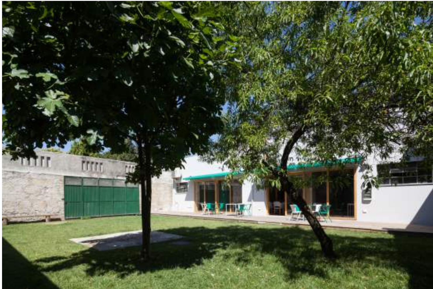
Armazém Cowork, colectivo oitoo