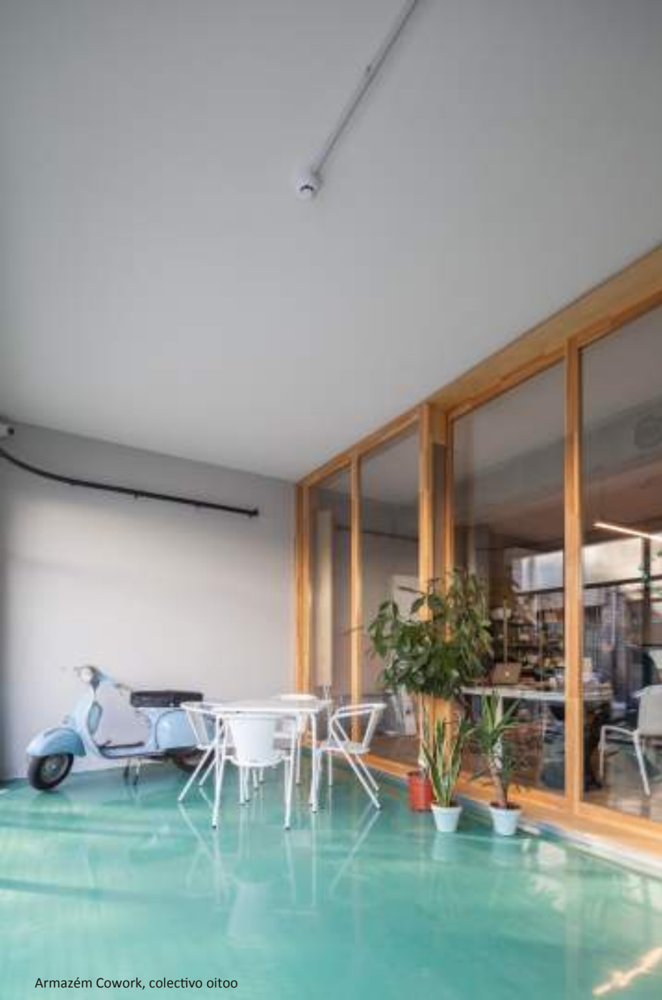
Armazém Cowork, colectivo oitoo